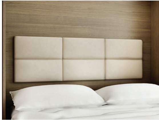
Moderno - Kopfpolster