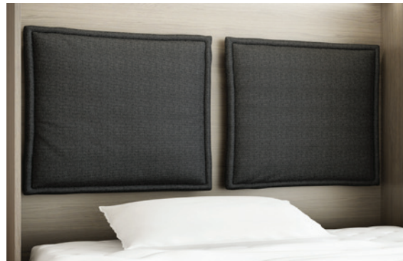
Quattro - Kopfpolster