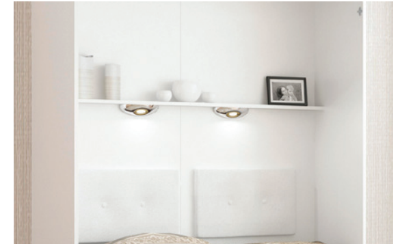
"I" - Regal