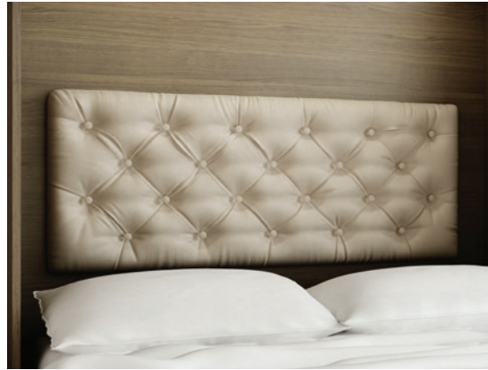
Retro - Kopfpolster