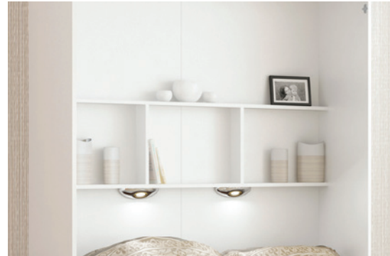
"H" - Regal