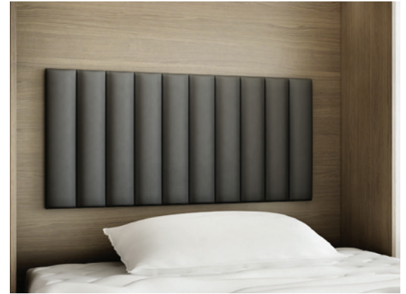
Bali - Kopfpolster