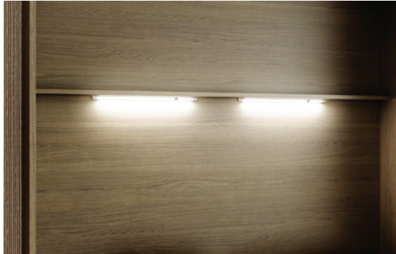
Led 40 - zwei einzeln einschaltbare Lampen mit integriertem Switch und Dimmer Funktion.