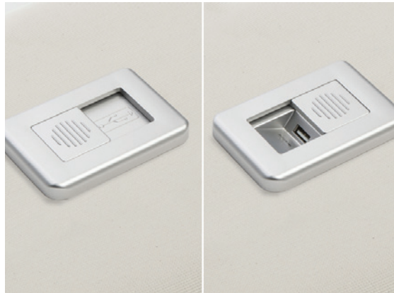
USB charger - exclusives Ladegerät